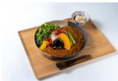
高野山 精進カレー