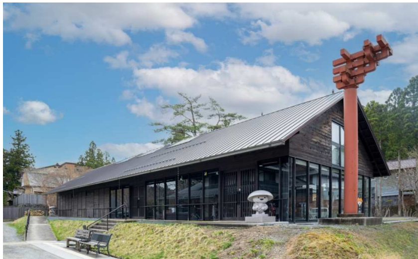
「高野山デジタルミュージアム」外観

高野山で 1200 年以上受け継がれてきた弘法大師空海の想いや歴史的建造物を、専属ナビゲーターがコントローラーを操作しながら文化資源の魅力を解説する VR シアター、猿田彦珈琲プロデュースのスペシャルティコーヒーや地元の食を提供するカフェ「高野山 café 雫」、旅の体験を持ち帰っていただくミュージアムショップにより構成。カフェ・ミュージアムショップでは、地域の生産者・事業者の協力により、地域事業者 1 人 1 人のストーリーある商品の想いを伝える役割も担うことで、地域経済の活性化を促します。