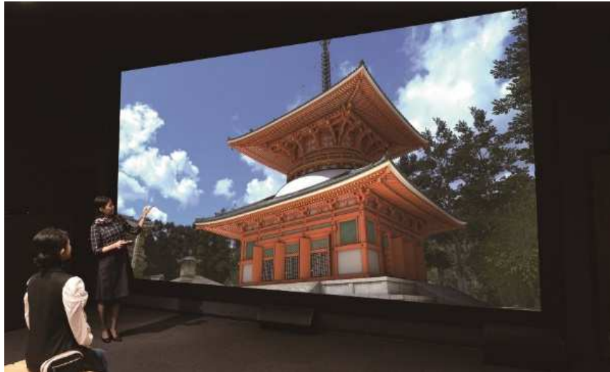
VR コンテンツ『高野山 壇上伽藍—地上の曼荼羅—』

また、VR シアター内の椅子や壁紙などには高野霊木を使用し、天井造作には高野山伝統の格子天井を用いるなど、高野山を体感できる空間づくりを行っています。